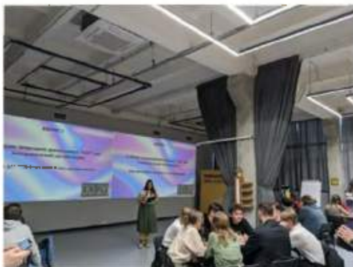
Рисунок 2 – Фрагмент квиза

Формат «Спортивный турнир» Антитеррористическая компонента может быть встроена и в спортивные мероприятия. Пример – организация турнира в память о герое антитеррористической операции по тому виду спорта, который в юности мог увлекаться данный герой.