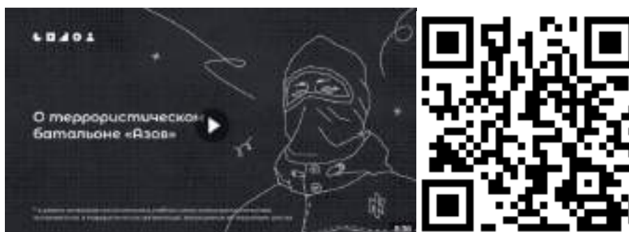
Рисунок 2 – Видеоролик, разъясняющий причины признания организации террористической

3) батальон «Азов» (см. рисунок 2) — военизированное подразделение, созданное в 2014 году на базе футбольных ультрас и праворадикалов Харькова и некоторых других украинских регионов. «Азовцы» причастны к массовым военным преступлениям против мирного населения Донбасса и Украины. Сама организация признана террористической в России по решению Верховного Суда Российской Федерации от 02.08.2022 г. № АКПИ22-411С. Батальон «Азов» входит в состав Национальной гвардии, подчиненной Министерству внутренних дел Украины. С 2014 года боевики батальона «Азов» систематически пытали, убивали и грабили мирных жителей ДНР, ЛНР и востока Украины. У батальона неонацистская идеология. Это проявляется в расизме, русофобии, восхвалении наследия Третьего рейха и украинских коллаборационистов в годы Второй мировой войны. Среди боевиков в том числе распространены радикальные неоязыческие взгляды. Свою идеологию боевики активно распространяют среди украинской молодежи через лагеря подготовки, печатную продукцию (комиксы, книги) и интернет-сообщества. С «Азовом» активно сотрудничает большое количество праворадикальных течений на Украине (признанных в России экстремистскими организациями), например, «Правый сектор», «УНА-УНСО», организация «Тризуб им. Степана Бандеры» и т.д.