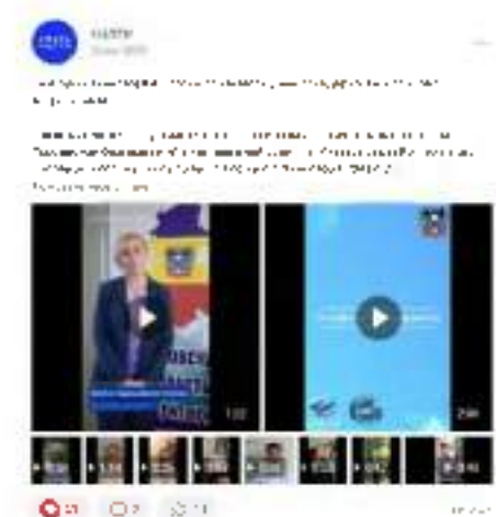
Рисунок 1. Пример видеороликов

Обязательность: студентам, намеренным принять участие в акции, следует представить технические (хронометраж — не более трех минут) и смысловые требования к создаваемому контенту (отсутствие сцен жестокости и насилия) (см. рисунок 2).