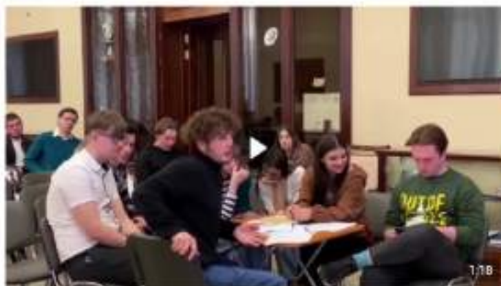
Дебаты «Идеология радикальных организаций» 1888 просмотров

В рамках дебатов можно: развенчивать мифы, декларируемые представителями радикальных идеологий для вербовки; развивать навыки критического мышления и ведения дискуссии; формировать в целом антитеррористическое сознание и активную гражданскую позицию. Рекомендуется для мероприятия вовлекать не более 20 человек (см. рисунок 5).