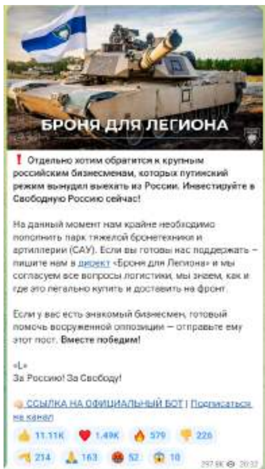
Рисунок 3 — Скриншот телеграм-канала легиона «Свобода России» с призывом к финансированию

Важно подчеркнуть, что помимо собственно пропаганды и распространения идеологии террористических организаций, а также вовлечения в деятельность террористических организаций существует еще одна угроза террористического характера — ложные сообщения о готовящемся террористическом акте. Только за 2021 год зафиксировано более 4,5 тысяч ложных сообщений о готовящихся терактах на объектах социальной инфраструктуры. Это может быть хулиганство, злой умысел, специфическое чувство юмора, желание проверить качество работы правоохранительных органов или антитеррористическую защищенность объекта и др. Во всех вышеперечисленных случаях за такой поступок придется нести уголовную ответственность. Ведь злоумышленник нарушает конструктивную деятельность общественных объектов, а правоохранителям приходится задействовать множество средств и сил, чтобы проверить объекты, которые якобы находятся под угрозой. За ложное сообщение о готовящемся теракте правонарушитель может быть наказан либо штрафами – от 200 тысяч рублей и до двух миллионов рублей, либо лишением свободы – от одного года до 10 лет. Ответственность за данный вид правонарушения наступает с 14 лет (статья 207 УК РФ «Заведомо ложное сообщение о акте терроризма»).