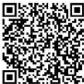
Рисунок 4 — Сценарий для проведения дебатов «Идеология радикализма»

Первая команда всегда будет представлять сторону радикальной идеологии. Задача команды студентов – найти контраргументы тех радикальных и спорных тезисов, которые будет озвучивать первая команда. Тем самым, участники будут вынуждены критически рассматривать постулаты радикальных идеологий, искать в них логические ошибки, несоответствия – самостоятельно приходиться к выводу о деструктивности любой радикальной идеологии (см. рисунок 4).